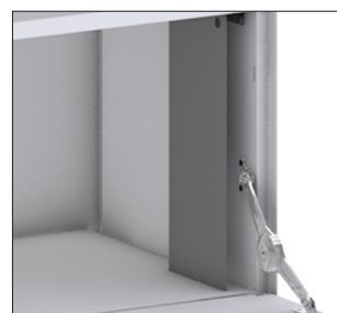
Cache pour charnières de clapet