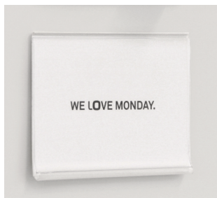
Porte-étiquettes clapets pour cartes de visite