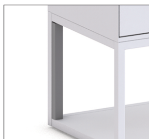
Guide-câbles au niveau du socle