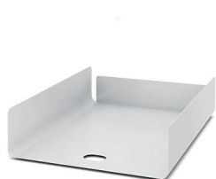
Boîte rangement papier

Les divers éléments d'organisation aident à mettre de l'ordre au bureau et à accéder rapidement à ses affaires sans perdre de temps.