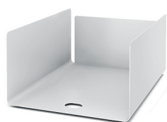
Boîte rangement papier haut