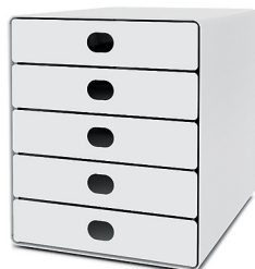
Boîte à 5 tiroirs