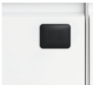
Serrure électronique (assisté par pile)

LO Locker s'accompagne, en option, d'accessoires particulièrement pratiques tels par exemple que l'alimentation électrique intégrée, qui transforme le système de rangement en une station d'accueil ou le système de code permettant d'éviter tout accès non autorisé aux objets personnels, ainsi que d'un passe-partout et d'un Codefinder pour garantir une utilisation sans problèmes. Les casiers se laissent personnalisés avec un marquage au choix.