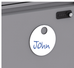
Étiquettes circulaires LO Spot