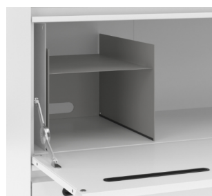
Boîte aux lettres