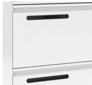
Klappe mit Briefkastenschlitz