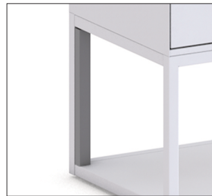
Kabelführung am Unterbau