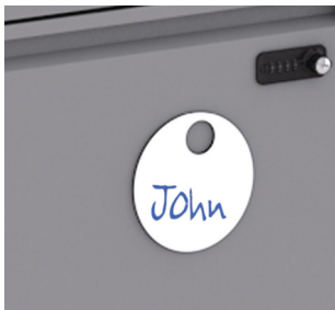
Beschriftung LO Spot