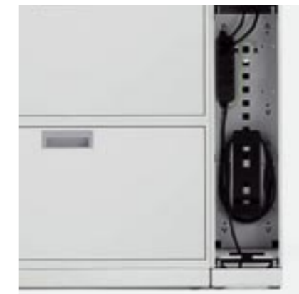
E-Modul E-module Module E Modulo E