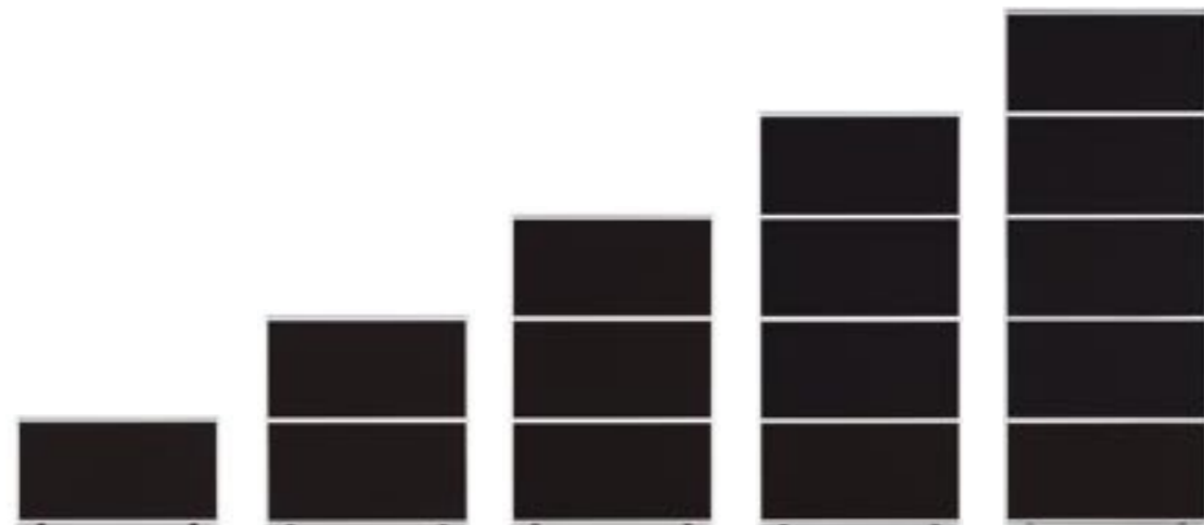
Wandmodule Wall modules Modules de cloison Moduli per pareti