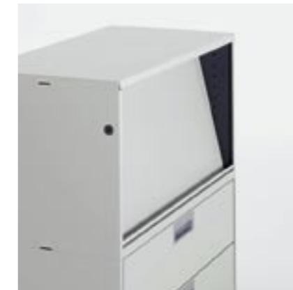
Schrägtablar Inclined shelf Rayon incliné Ripiano inclinato