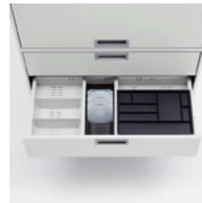
Einteilungsmaterial Partition material Matériel de subdivision Materiale di suddivisione