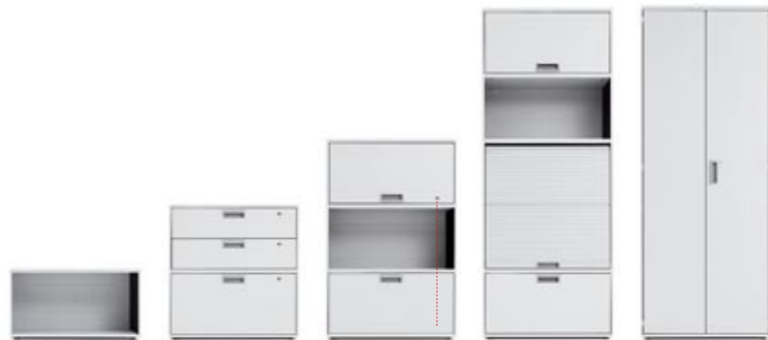
Einzelverschluss Individual locking Fermeture individuelle Chiusura singola