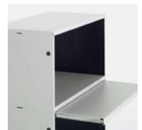
Ausziehtablar Pull-out shelf Rayon extensible Ripiano estraibile