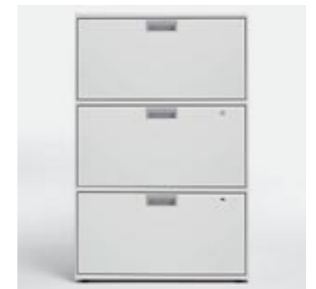
Fronten Fronts Faces avant Elementi frontali