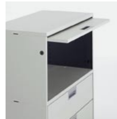
Klappe Flap Rabat Ribalta

Lista QUB soddisfa le massime esigenze. Il prodotto è naturalmente caratterizzato da una qualità di lavorazione senza compromessi, da una straordinaria precisione di fabbricazione, e dall'impiego di materiali pregiati. Ne deriva un sistema avveniristico che, anche in futuro, conserverà l'impronta della perfezione.