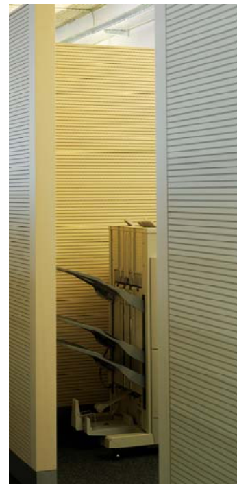
(11) Erlebniswelt Büro: Servicebereich

Texte und Bilder (300dpi) stehen unter www.lista-office.com/press als Downloads zur Verfügung.