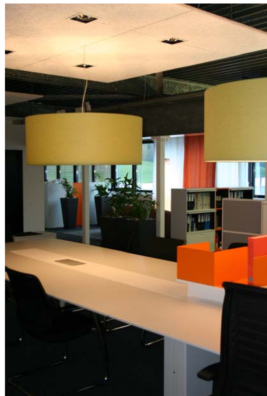
(4) Erlebnisswelt Büro: Funktional und visuell