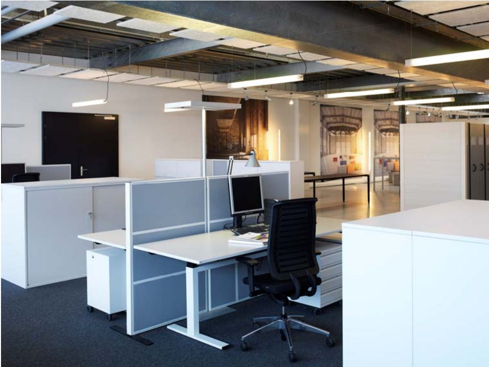
(9) Erlebniswelt Büro: Konzentration und Kommunikation