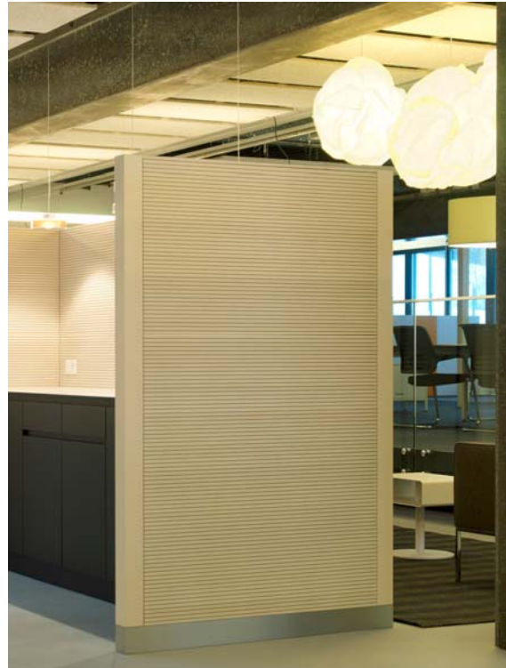
(6) Erlebnisswelt Büro: Entspannung und Regeneration