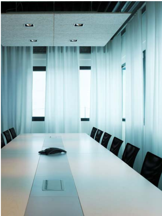
(7) Erlebnisswelt Büro: Sitzungszimmer – Formelle Kommunikation ...