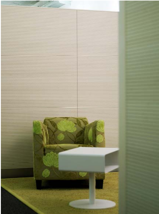
(5) Erlebnisswelt Büro: Informelle Kommunikation