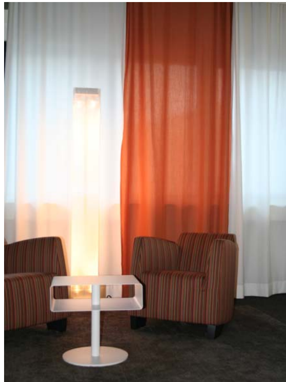
(8) ... und Lounge-Ambiente