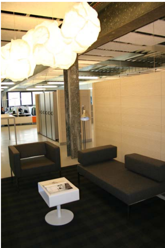
(3) Erlebnisswelt Büro: Bibliothek / Lesezone