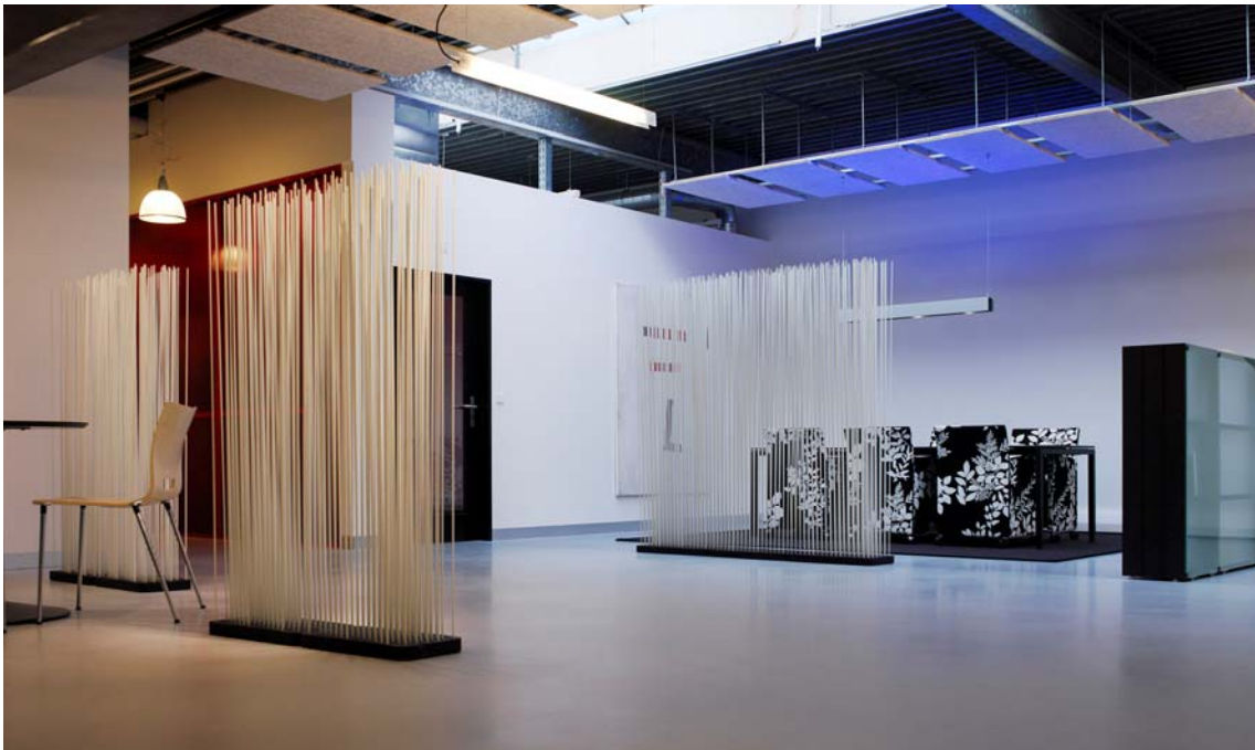
(1) Erlebniswelt Büro

Die Kompetenz für Bürogesamtkonzepte zeigt sich in individuellen Lösungen, die vier wichtige Elemente vereinen: Flächeneffizienz, Kommunikation, Inspiration und Konzentration. Das Grossraumbüro (open space) wird aufgewertet und in Zonen aufgeteilt. Ruhige Zonen wechseln sich mit kommunikativen ab. Lesezonen sind genauso vorhanden wie Treffpunkte, wo man sich austauscht. Konzentriertes Arbeiten in Kombination mit Entspannungs- oder Regenerationsmöglichkeiten begünstigen sich gegenseitig und fördern den Output. Licht, Farben und Einrichtungsobjekte setzen Akzente und prägen Identität und Ambiente der unterschiedlichen Zonen. Entstanden ist eine neue Erlebniswelt Büro, die als Gesamtkonzept funktional und visuell überzeugt.